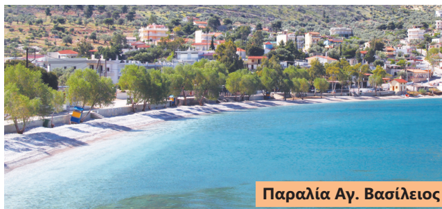
Παραλία Αγ. Βασίλειος